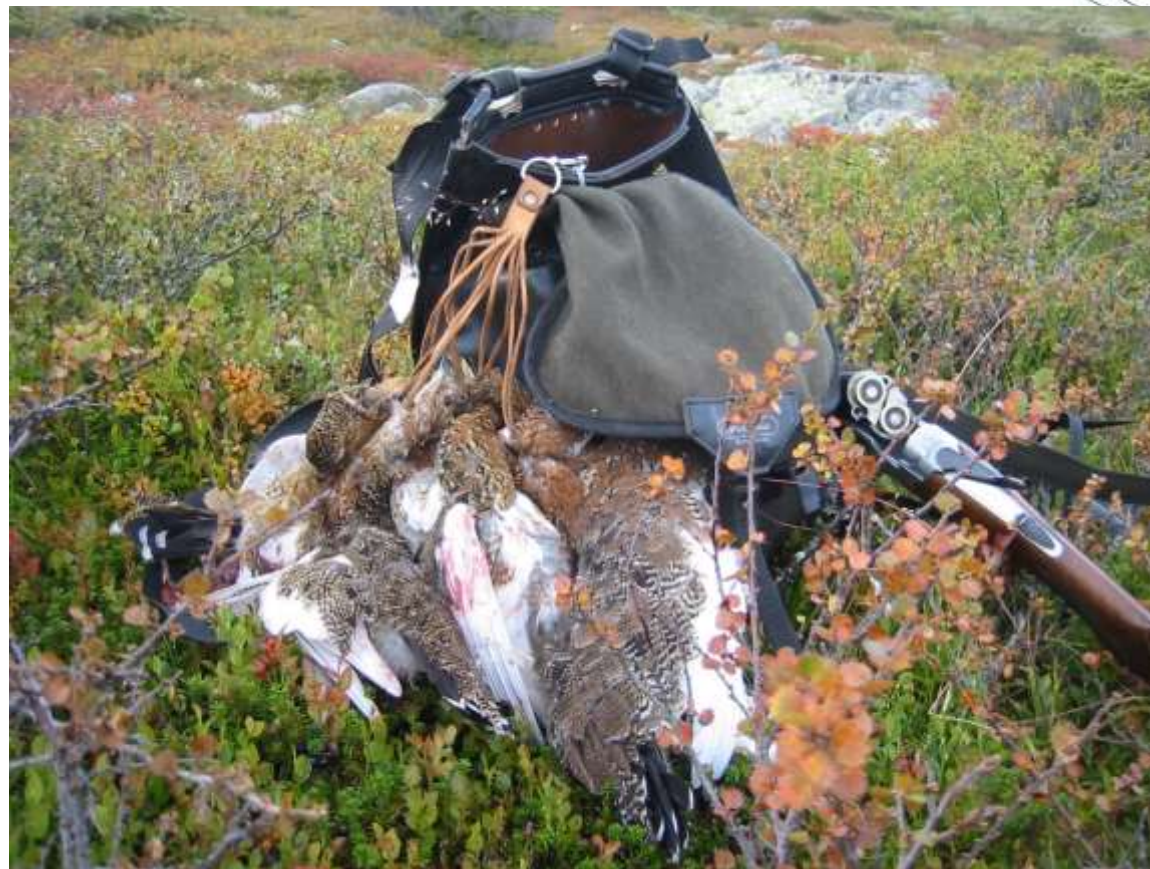
Ivrig småviltjeger med stående fuglehund